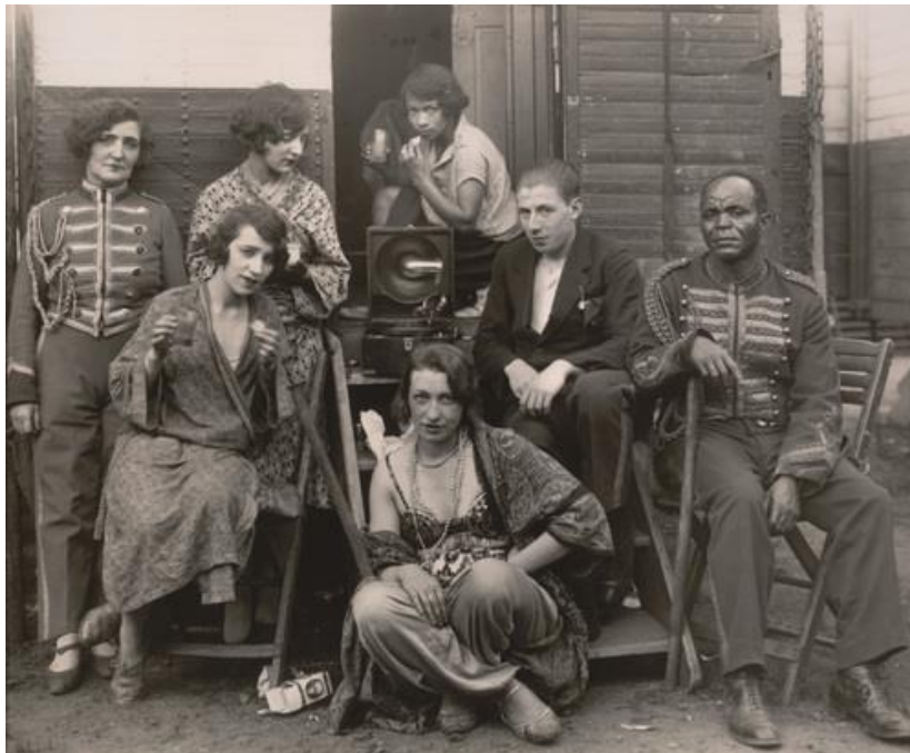
A. Sander « Old cirque circus people »

Les deux personnages se sont inspirés d'un univers burlesque qui retrace et évoque le cinéma muet et la poésie des cirques anciens.